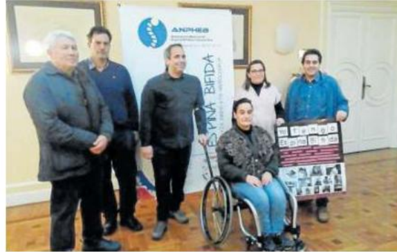
Miembros de la asociación, durante la entrevista.

LABOR PREVENTIVA Anpheb hizo hincapié en las medidas preventivas para frenar su incidencia. “Se calcula que uno de cada 1.000 niños presenta una malformación congénita de este tipo, pero tres de cada cuatro casos se evitarían o se minimizaría su impacto